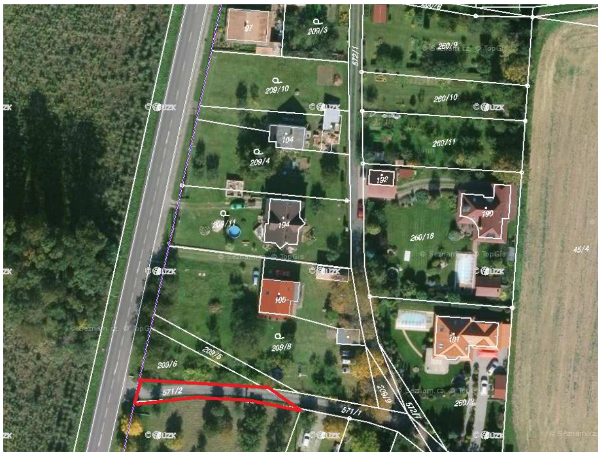
571/2 v k.ú. Chotěnice